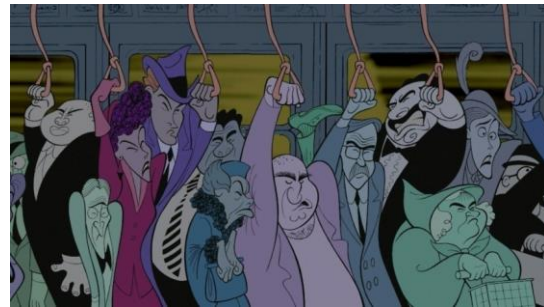
Figura 4. Carencia de educación ética a través del ajetreo de los ritmos de vida modernos en el cortometraje “ Rhapsody in blue ” de Fantasia 2000 (Disney y Ernst, 2000)

Hollow y el señor sapo (Disney, 1949) se potencian las consecuencias éticas y directas emergidas tras las actuaciones que contradicen dicha norma social. Por ello, se espera que la figura protagonista ingrese en prisión tras la ejecución del acto delictivo de la compra de un auto robado.