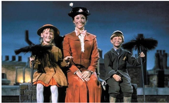
Figura 5. Jane y Michael Banks descubriendo aprendizajes en primera persona desde la propia práctica en la realidad social fuera del barrio acomodado donde viven en Mary Poppins (Disney y Walsh, 1964)