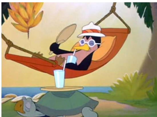
Figura 11. El pingüino Polo mostrando su diferencia tras compartir su necesidad intrínseca de vivir en el trópico tras ser incapaz de tolerar las bajas temperaturas del Polo Antártico donde se encuentra en “El pingüino de sangre fría” de Los tres caballeros (Disney, 1944)

En contraposición con la barrera del bullying y de la concepción tradicionalista de la educación, se etiqueta como positiva la variable diversidad, ya que presenta de manera puntual una Disney defensora de la pluralidad de opciones, personas, tendencias, etc., que debe ser preservada y cuidada. No obstante, esta temática aparece de manera muy superficial, por ello se precisa abordarla y dedicar un tiempo en las aulas para su tratamiento. Concretamente, se manifiestan tres ejemplos en tres personajes. En primer lugar, Polo un ave marina del corto “El pingüino de sangre fría” en Los tres caballeros (Disney, 1944) que quiere dejar su vida en los glaciares y trasladarse a Argentina para disfrutar de un clima cálido. En segundo lugar, con el corto “El gaucho volador” de Los tres caballeros (Disney, 1944) se presenta un burro alado, condición a partir de la cual consigue ganar la carrera contra los corceles más veloces que se burlan de su diversidad y de su condición como asno entendida inferior a la de caballo. También con la figura de Silbatín del corto “Aventura en alta mar” en Tiempo de melodía (Disney, 1948) se comparte la necesidad de respetar las individuales de quienes forman la infancia, teniendo en cuenta sus procesos evolutivos y tolerando sus elecciones de identidad las cuales en ocasiones no se corresponden con las expectativas que la propia familia y/o plantilla de docentes se forja respecto a cada menor.