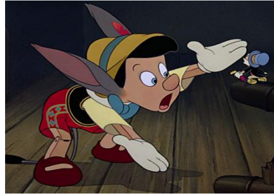
Figura 6. Pinocho experimentando el arrepentimiento de sus actos tras la imposición de un castigo eterno a su persona: convertirse en burro; en Pinocho (Disney, 1940a)

que un/a menor modifica su conducta porque sea conocedor de las reglas y/o normas que rigen la ética social, sino porque el no cumplimiento de las mismas le generan unas consecuencias negativas proyectadas sobre su persona que es realmente aquello que pretende evitar.