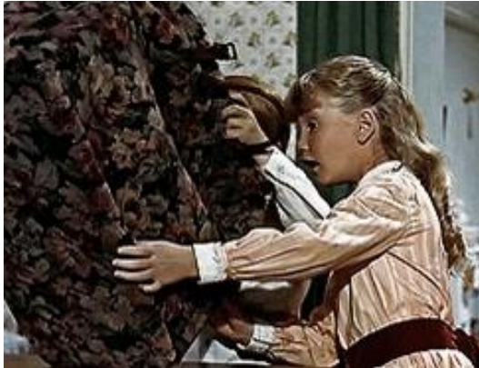
Figura 12. Mary Poppins despertando la curiosidad en Michael y Jane tras demostrar que su bolso contiene todo tipo de objetos en Mary Poppins (Disney y Walsh, 1964)

por incluir a Jane y Michael en las actividades diarias de la casa. Ella les dice: “tenemos que ir a la casa del afinador de pianos, a la tienda de la señora Cori y a la pescadería a por un lenguado”. Finalmente, con este filme se transmite una idea de desaularización, es decir, “salir a la calle” para recibir una educación significativa.