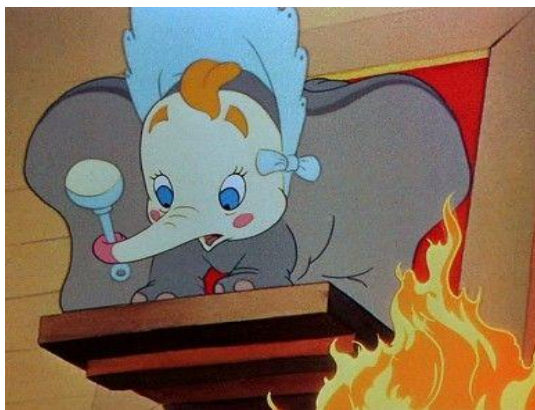
Figura 9. Acoso a Dumbo y ridiculización del animal por su condición diversa en Dumbo (Disney, 1941)

normatividad uniforme y que agrede al derecho universal de individualidad personal.