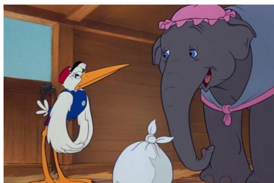
Figura 8. Perduración del mito de la cigüeña como animal portador de bebés a sus respectivas familias en Dumbo (Disney, 1941)

sesgada del sentimiento de la amistad como inmutable e infinito que genera incompreensión en dichas personas cuando experimentan un duelo por pérdida de un ser querido. Estos ejemplos manifiestan la tendencia sentimentalista de la propia Disney como productora que trata de mantener al margen a quienes forman parte de la infancia de aquellas situaciones que son condición sine qua non para la propia existencia, tales como el hecho de la muerte.