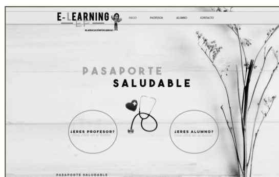
Figura 3. Pasaporte saludable. Elaboración propia.

A modo de ejemplo mostramos el resultado obtenido de la creación de un recurso didáctico para el fomento de los hábitos saludables relacionados con la actividad física y la alimentación en el curso de 5º de Primaria, ya que va a ser implantado dicho recurso como proyecto piloto (Fig. 3):